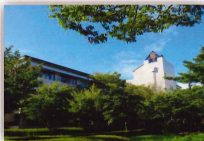
こころの医療センター